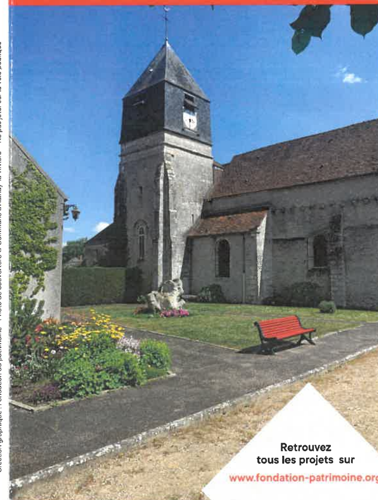
Création graphique : Fondation du patrimoine - Photo de couverture © Commune d'Aulnay-la-Rivière - Ne pas jeter sur la voie publique

Retrouvez tous les projets sur www.fondation-patrimoine.org